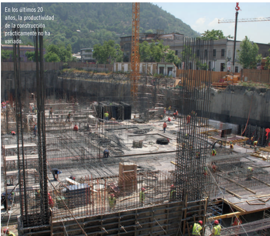
En los últimos 20 años, la productividad de la construcción prácticamente no ha variado.

“PARA QUE LA industria de la construcción dé un salto significativo en productividad, debe trabajar de manera más colaborativa e integrar a la cadena de valor todo lo que la era digital ofrece en materia de desarrollo de materiales, tecnología e industrialización”, comenta Pedro Plaza.