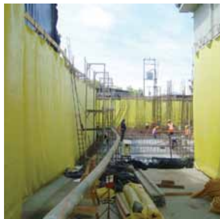
Láminas de PVC para impermeabilización de subterráneos.