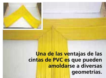
Una de las ventajas de las cintas de PVC es que pueden amoldarse a diversas geometrías.