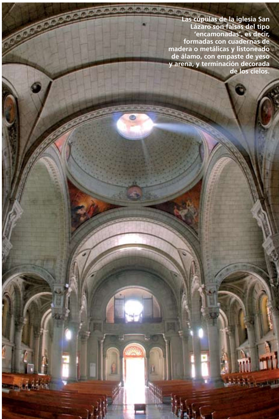
Las cúpulas de la iglesia San Lázaro son falsas del tipo ‘encamonadas’, es decir, formadas con cuadernas de madera o metálicas y listoneado de álamo, con empaste de yeso y arena, y terminación decorada de los cielos.

Como explica el arquitecto y profesor de la Universidad de Chile, Fernando Riquelme, “los autores desarrollaron el proyecto siguiendo las características del estilo ‘neorrománico’, especialmente en sus fachadas; en tanto que en el interior la espacialidad se