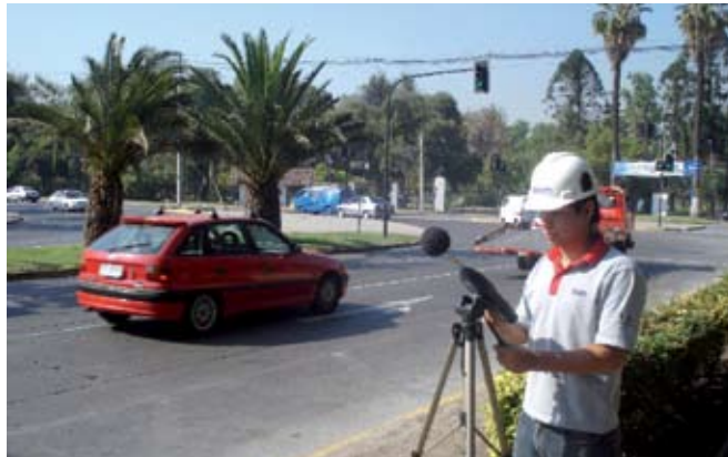
Mediciones de ruido de tráfico efectuadas por IDIEM.

Para el caso del ruido exterior, se determinará la calidad del entorno del edificio y, en consecuencia, se definirá la protección a aplicar sobre la envolvente para protegerla de este agente físico. Cuando se trate de edificios cuyas actividades sean ruidosas (salas de eventos e industrias, entre otros), la protec-