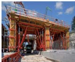
PERI VARIOKIT, TÚNELES ABIERTOS