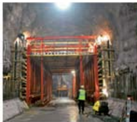
PERI VARIOKIT, TÚNELES MINEROS