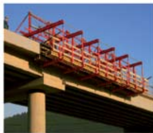
PERI VARIOKIT, PUENTES