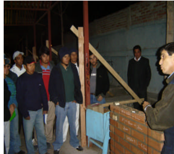
CURSO DE ALBAÑILERIA