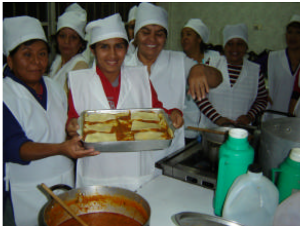
CURSO AYUDANTE DE COCINA