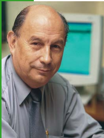
Germán Millán, director general de Obras Públicas del Ministerio de Obras Públicas (MOP).